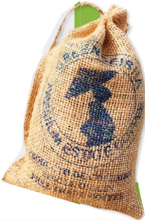
เมล็ดกาแฟเกอิชาจากไร่ TrulyAll ในโคลอมเบีย วางขายบนเว็บ amazon.com

คอลัมน์: Good Morning Coffee: Panama Ge(i)sha กุหลาบคิมหันต์แห่งแคริบเบียน