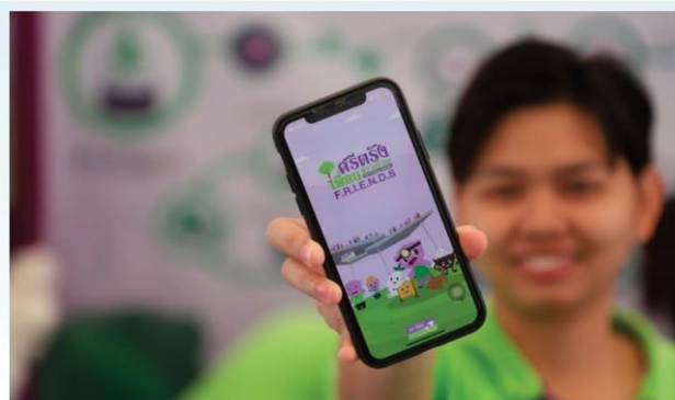
บริษัทศรีตรัง ชวนสัมผัสประสบการณ์ใหม่บนมือถือ เพื่อชาวสวนยาง ที่ช่วยให้ขายยางได้ง่ายขึ้น