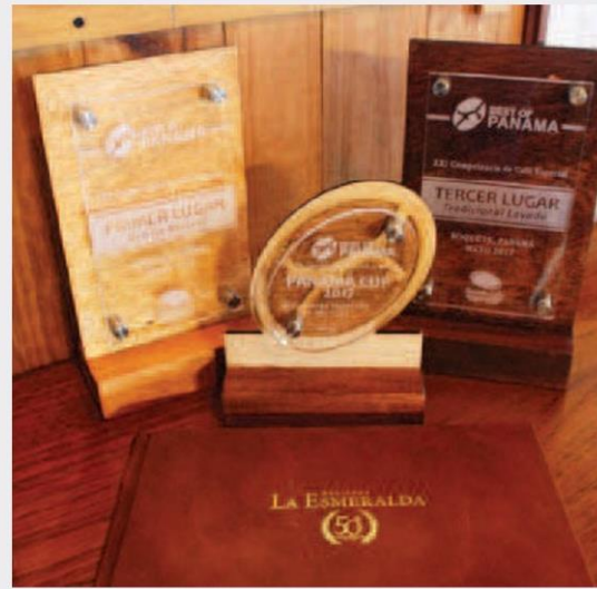
รางวัลบางส่วนของไร่ Hacienda La Esmeralda

อัตลักษณ์การผลิตและแปรรูปกาแฟของปานามา นั้น มุ่งเน้นดูแลสิ่งแวดล้อมและธรรมชาติรอบๆ ตัว มีแรงงานคนเก็บเกี่ยวผลผลิต ใช้มือปลิดผลเชอร์รี่กาแฟเต็มที่ ภายใต้คอนเซ็ปต์ กาแฟ ป่า และคน กลมกลืนกันอยู่ในระบบนิเวศ ทำให้เป็นที่สนใจของจากนักธุรกิจยุโรปและสหรัฐฯ ที่ทุ่มเงินเข้ามาซื้อไร่กาแฟคุณภาพดีหลายแห่ง เพื่อทำไร่กาแฟออร์แกนิกและกาแฟพิเศษ (Specialty Coffee) เนื่องจากเป็นกาแฟราคาแพงติดท็อปเท็นของโลก เน้นเน้นว่าการเดินทางมีต้นทุนเสมอทางเศรษฐกิจ ราคากาแฟเกอิชาในปานามา ตกประมาณ 9 ดอลลาร์ต่อหนึ่งแก้ว แต่หากอยู่ในนิวยอร์กอาจต้องควักกระเป๋าจ่ายถึง 18 ดอลลาร์ต่อแก้ว และพุ่งไปถึง 68 ดอลลาร์ในดูไบ เห็นตัวเลขแล้วต้องร้องโอ้โห...กันเลยทีเดียว