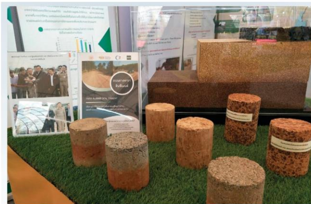
ต้นแบบ ถนนยางพาราดีนซีเมนต์ งานวิจัยที่ไม่เคยหยุดพัฒนา จาก มจพ.

เข้าที่นอนลม หรือที่นอนโฟม ที่ใช้อยู่ในปัจจุบันอีกด้วย และกิจกรรมพิเศษสุดเพื่อพี่น้องชาวสวนยาง ศูนย์เทคโนโลยีโลหะและวัสดุแห่งชาติ (MTEC) ได้จัดทีมนักวิจัยลงพื้นที่พบเกษตรกรชาวสวนยาง เพื่อรับทราบปัญหา และตอบโจทยงานวิจัยที่สามารถใช้แก้ปัญหาได้จริง ทางด้าน มหาวิทยาลัยเทคโนโลยีพระจอมเกล้าพระนครเหนือ