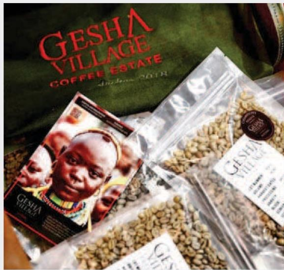
สารภาพพร้อมจำหน่ายของไร่ Gesha Village Coffee Estate ในเอธิโอเปีย

คอลัมน์: Good Morning Coffee: Panama Ge(i)sha กุหลาบคิมหันต์แห่งแคริบเบียน