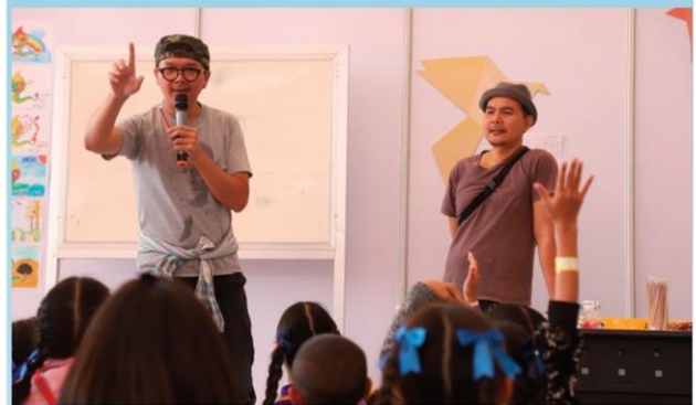
แน่นทุกรอบกับห้องเรียนศิลปะ