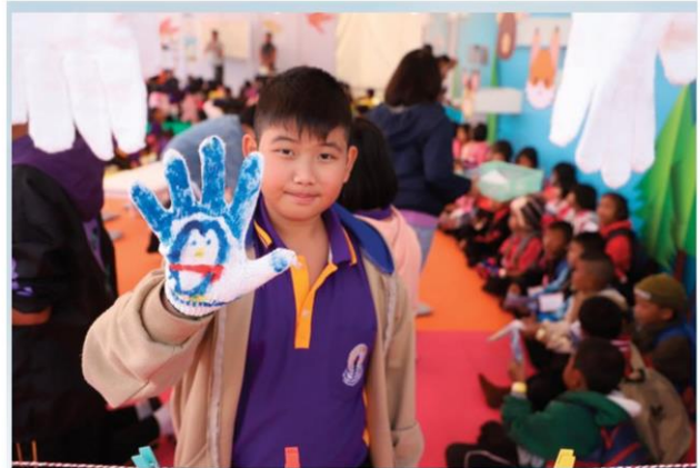
กิจกรรมทำถุงมือหิ้วหนับ

ในส่วนของกิจกรรมศิลปะ อธิวิรุฑูร์ สุริยมาตย์ นักวาดการ์ตูนไทย ที่ไปคว้ารางวัลจากประเทศญี่ปุ่น เล่าถึงกิจกรรมในลานเด็กเล่นครั้งนี้ว่า