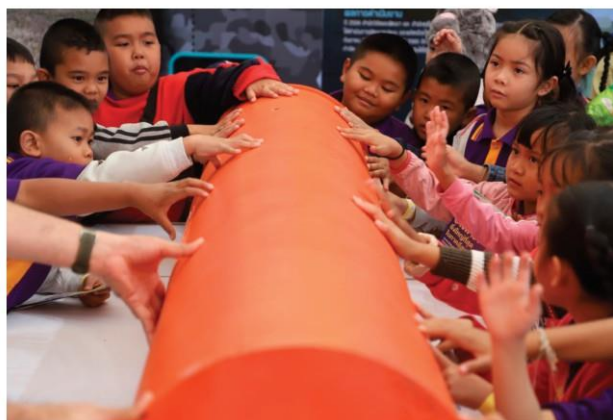
เด็กๆ ให้ความสนใจหุ่นยางพาราตักผักตบชวาของกรมชลประทาน

สิ่งเหล่านี้เป็นเพียงส่วนหนึ่งของไฮไลท์กิจกรรมที่เกิดขึ้นในงาน “วันยางพาราบึงกาฬ 2563” ระหว่างวันที่ 12 - 18 ธันวาคม 2562 ณ สนามหน้าที่ว่าการอำเภอเมือง จังหวัดบึงกาฬ