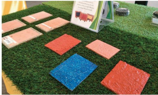
ผิวถนบก้นส้น งานวิจัยจาก มจพ.

อีกผลงานนวัตกรรมด้านยางพารา ที่ได้รับความสนใจจากผู้ชมงานมากที่สุดคือ ที่นอนนํ้ายางพาราเพื่อสุขภาพ ที่มีคุณสมบัติเรื่องความทนทาน ยืดหยุ่นสูง ช่วยป้องกันความทุกข์ทรมานของผู้ป่วย ผู้สูงอายุติดเตียงจากแผลกดทับ เนื่องจากช่วยกระจายน้ำหนักกดทับอย่างเหมาะสม ไม่ยุบตัวเมื่อใช้เป็นเวลานาน และมีการใช้งานจริงไปแล้วกว่า 200 ชุด ซึ่งการผลิตที่นอนนํ้ายางพาราเพื่อสุขภาพดังกล่าว นอกจากเป็นการแปรรูปนํ้ายางช่วยเหลือเกษตรกรแล้วยังมีส่วนช่วยลดการนำ