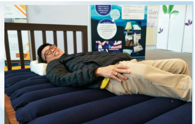
ที่นอนนํ้ายางพารา เพื่อป้องกันแผลกดทับ

การยางแห่งประเทศไทย (กยท.) เป็นอีกหน่วยงานที่มีการวิจัยดูแลเรื่องยางพาราครบวงจร โดยปีนี้แม้ราคายางจะตกต่ำ แต่ กยท. ยังคงส่งเสริม และแก้ปัญหาเรื่องของยางพารามาตลอด โดยงานนี้ มาในธีม ศูนย์กลางการผลิต เสริมแนวคิดนวัตกรรม นํ้ายางพาราไทย ลู่ความยั่งยืน นำเรื่องของเทคโนโลยี “ โครงข่ายการเกษตร ” มาเป็นตัวช่วยเกษตรกรชาวสวนยาง ร่วมด้วยการส่งเสริมความรู้เรื่องการค้าประกันรายได้เกษตรกรชาวสวนยาง การเกษตรเสริมรายได้ได้มีมายัง