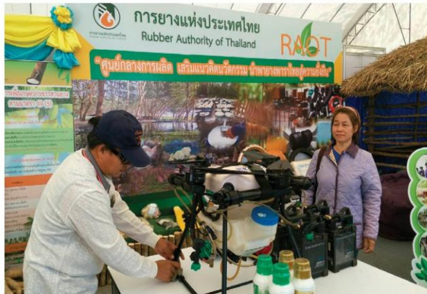
สาธิตโดรนเพื่อการเกษตร จากการยางแห่งประเทศไทย

ยางพาราประเทศจีน ได้นำเรื่องของอุตสาหกรรมการผลิตยางรถยนต์ มาจัดแสดง ตอกย้ำความสำคัญของยางพาราที่ยังคงมีตลาดรองรับ