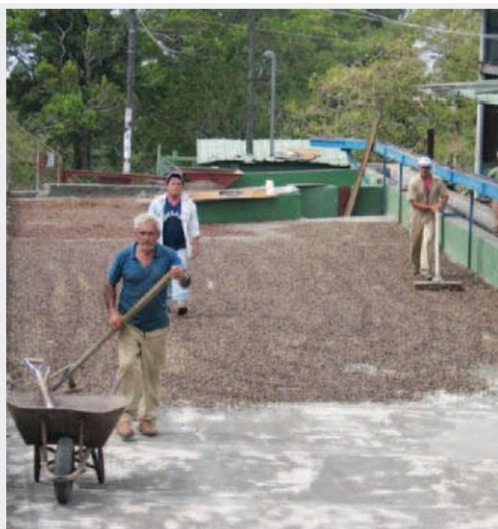
วิธีตากกาแฟแบบดั้งเดิมของไร่ Cafe Ruiz

ปานามาตกเป็นอาณานิคมของสเปนในศตวรรษที่ 16 แต่ประวัติแหล่งปลูกกาแฟนั้นสืบสาวย้อนหลังไปได้ราวต้นศตวรรษที่ 20 ถือว่าไม่นานเมื่อเทียบกับแหล่งปลูกกาแฟอื่นๆ ในทวีปอเมริกา อย่างบราซิล จาไมกา, กัวเตมาลา หรือเฮติ แต่ด้วยความมุ่งมั่น ลึกซึ้ง บวกกับความเชี่ยวชาญของทีมงานเจ้าของไร่ ที่ได้บ่มเพาะหล่อเลี้ยงกาแฟปานามาจากที่เคยไร้ชื่อเสียง ให้เป็นกาแฟมีคุณภาพติดอันดับต้นๆ ของโลก เรียกว่า 'กาแฟยุคใหม่' ต้องมีกาแฟในตำนานอย่างเกอิชา เป็นนางเอกไว้คอยบริการนักดื่มสายดำที่นิยมกาแฟดริปทั้งหลาย